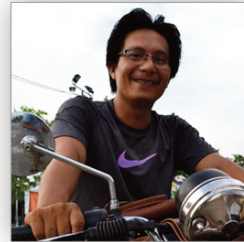
Quang Nguyen Vietnam