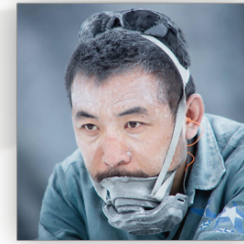
Yang Liu China